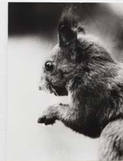
© Jochem Lempert / Aurélien Mole