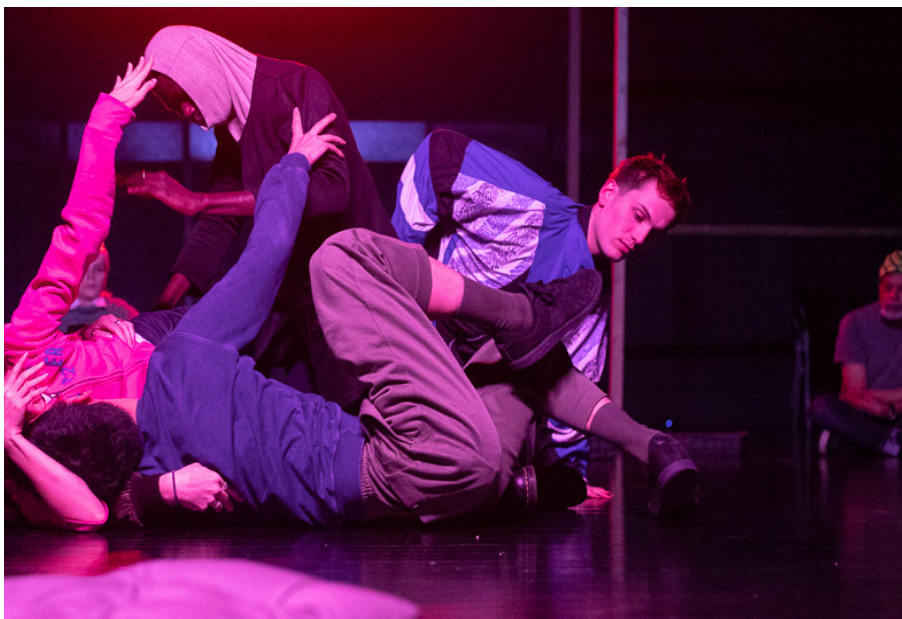
Exercice commun 2024