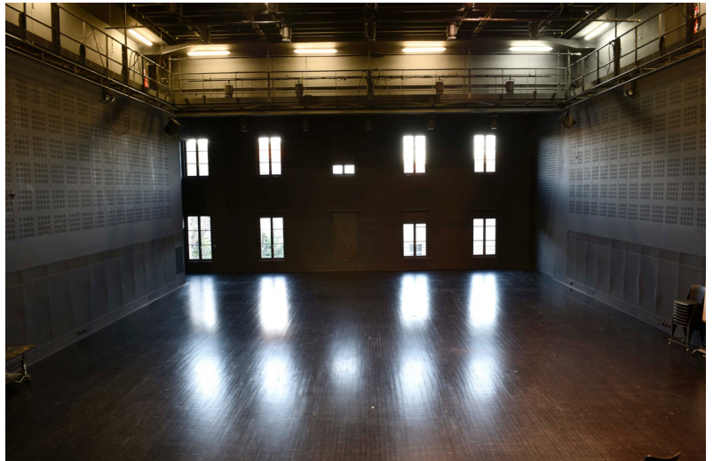
Studio Bagouet — lointain + passerelles