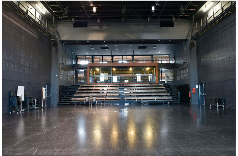
Studio Bagouet — gradins et régie

Murs gris foncé, fenêtres sur deux hauteurs au lointain, baie vitrée derrière la régie, système d'occultation par stores électriques.